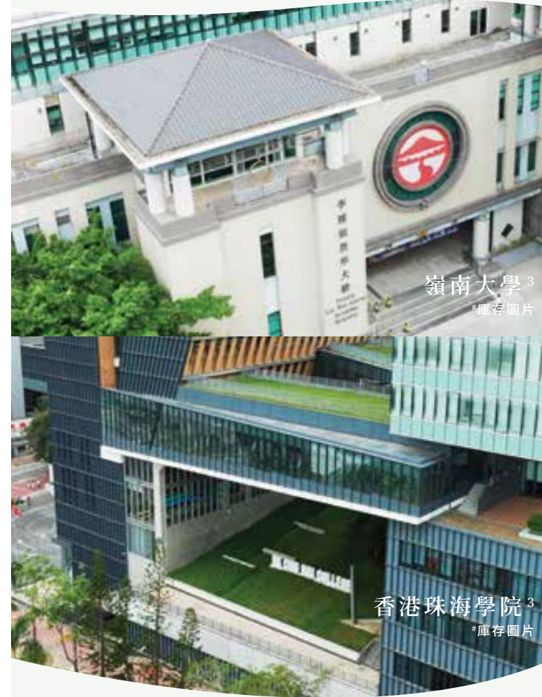
嶺南大學 3 「庫存圖片」