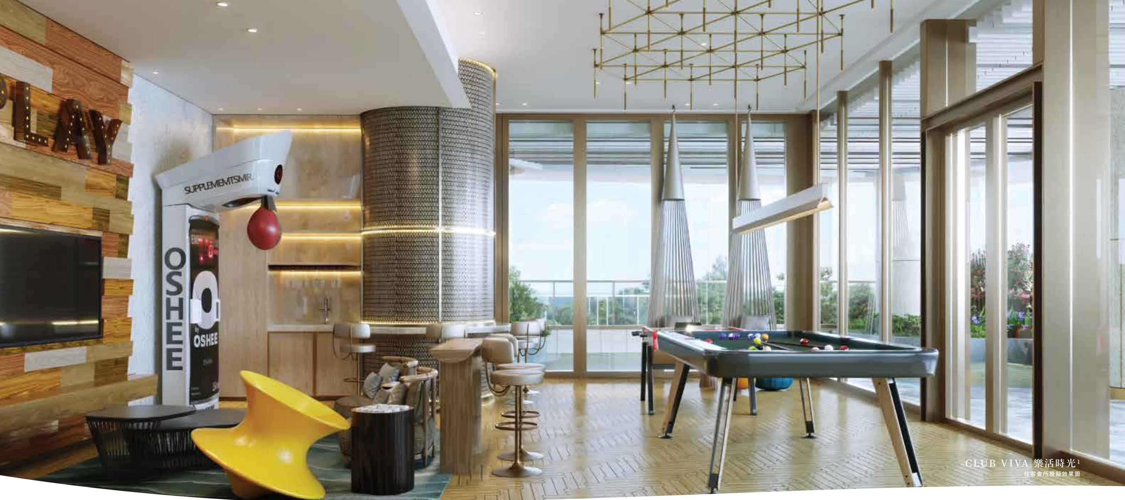
CLUB VIVA 樂活時光 1 住客會所模擬效果圖