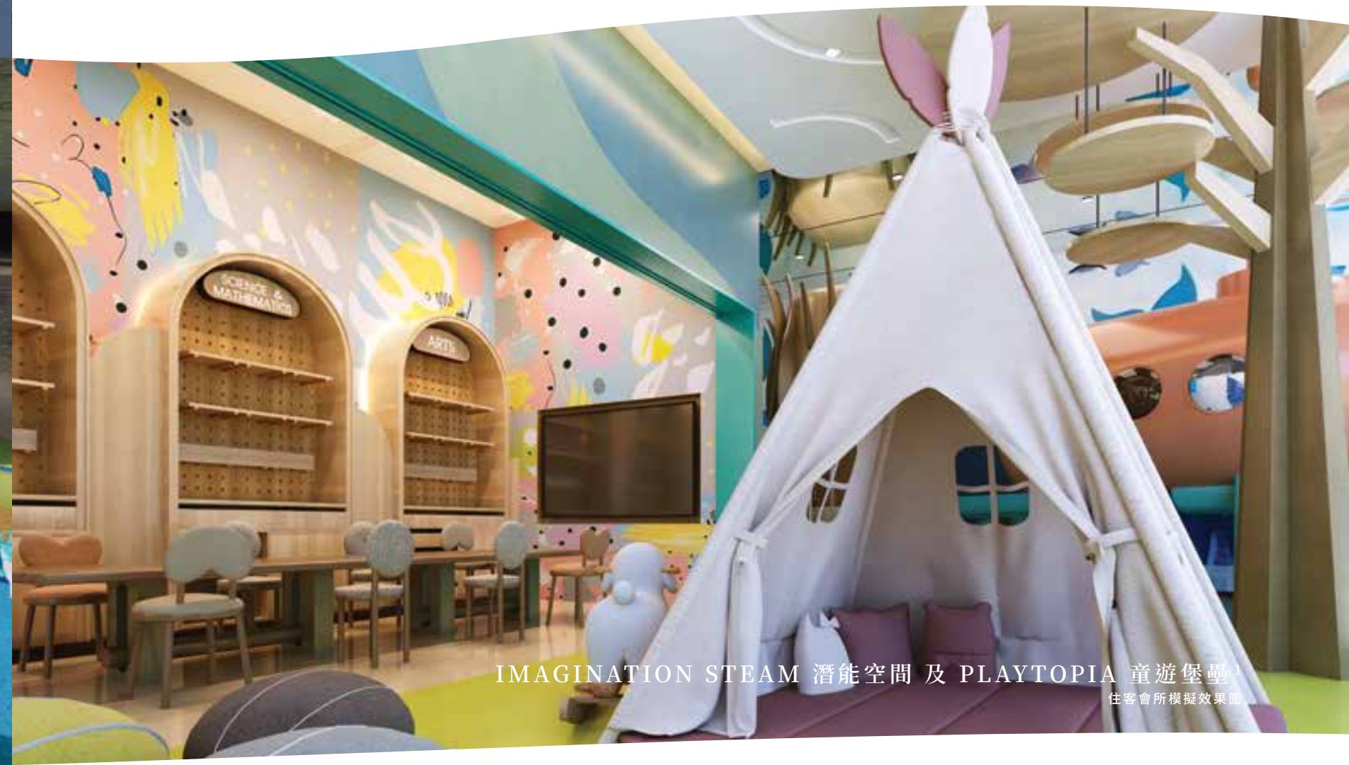
IMAGINATION STEAM 潛能空間 及 PLAYTOPIA 童遊堡壘 1 住客會所模擬效果圖