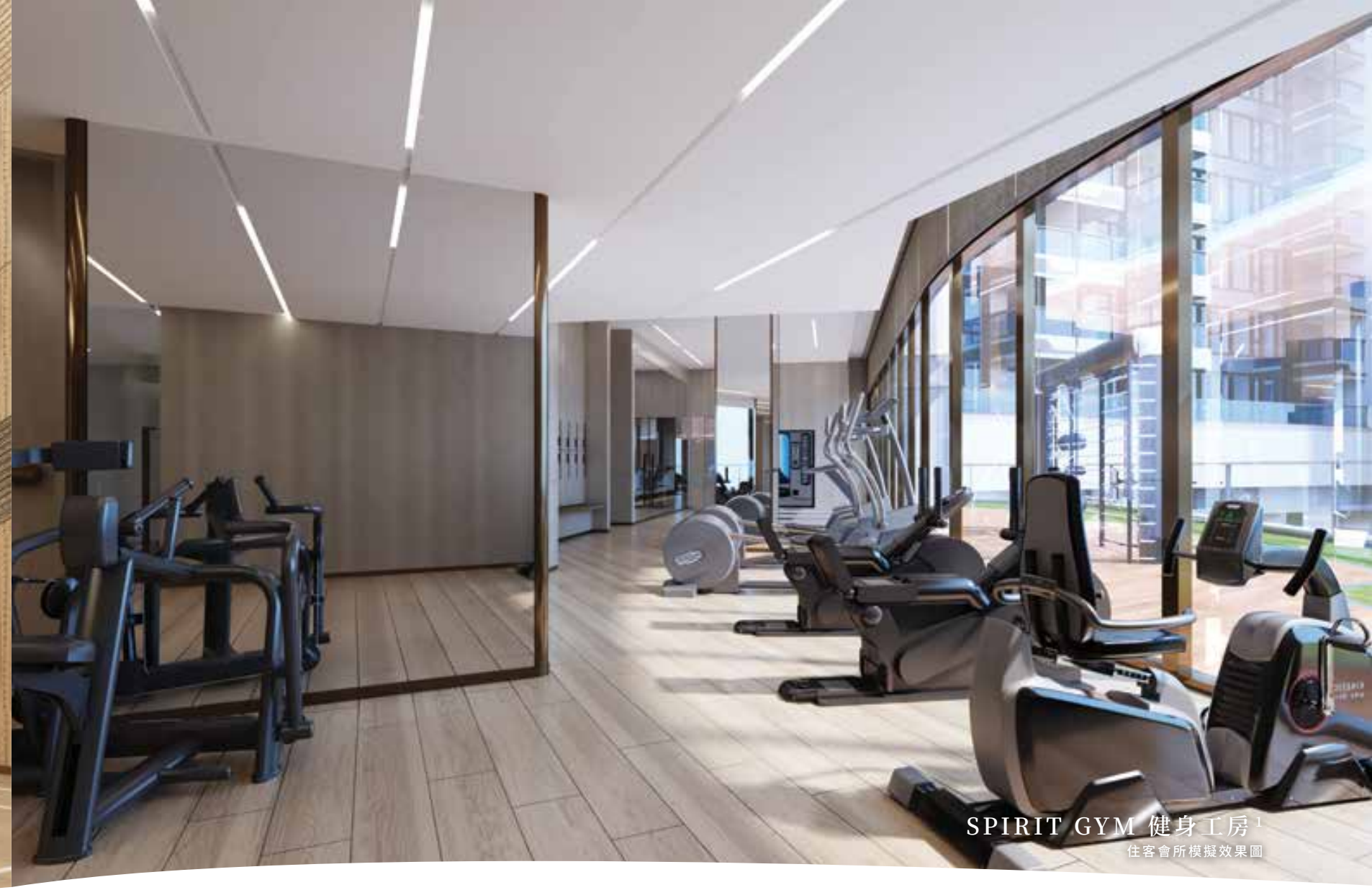
SPIRIT GYM 健身工房 1 住客會所模擬效果圖