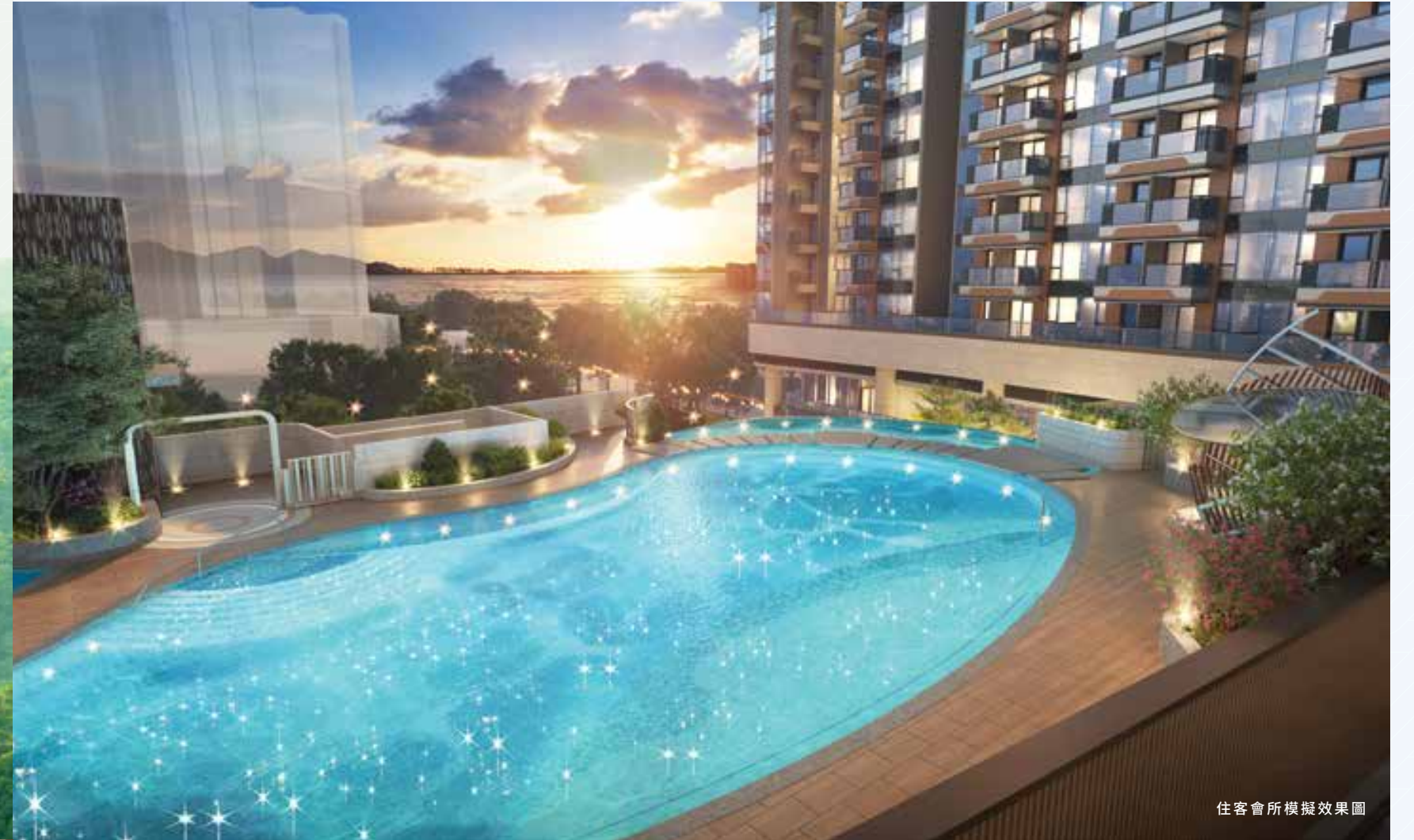
住客會所模擬效果圖