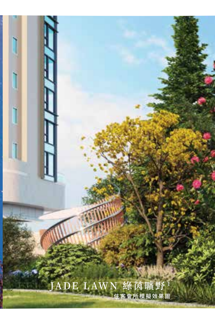
JADE LAWN 綠茵曠野 1 住客會所模擬效果圖