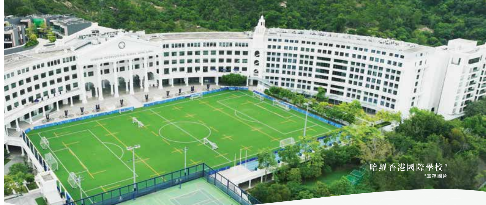
哈羅香港國際學校 3 「庫存圖片」