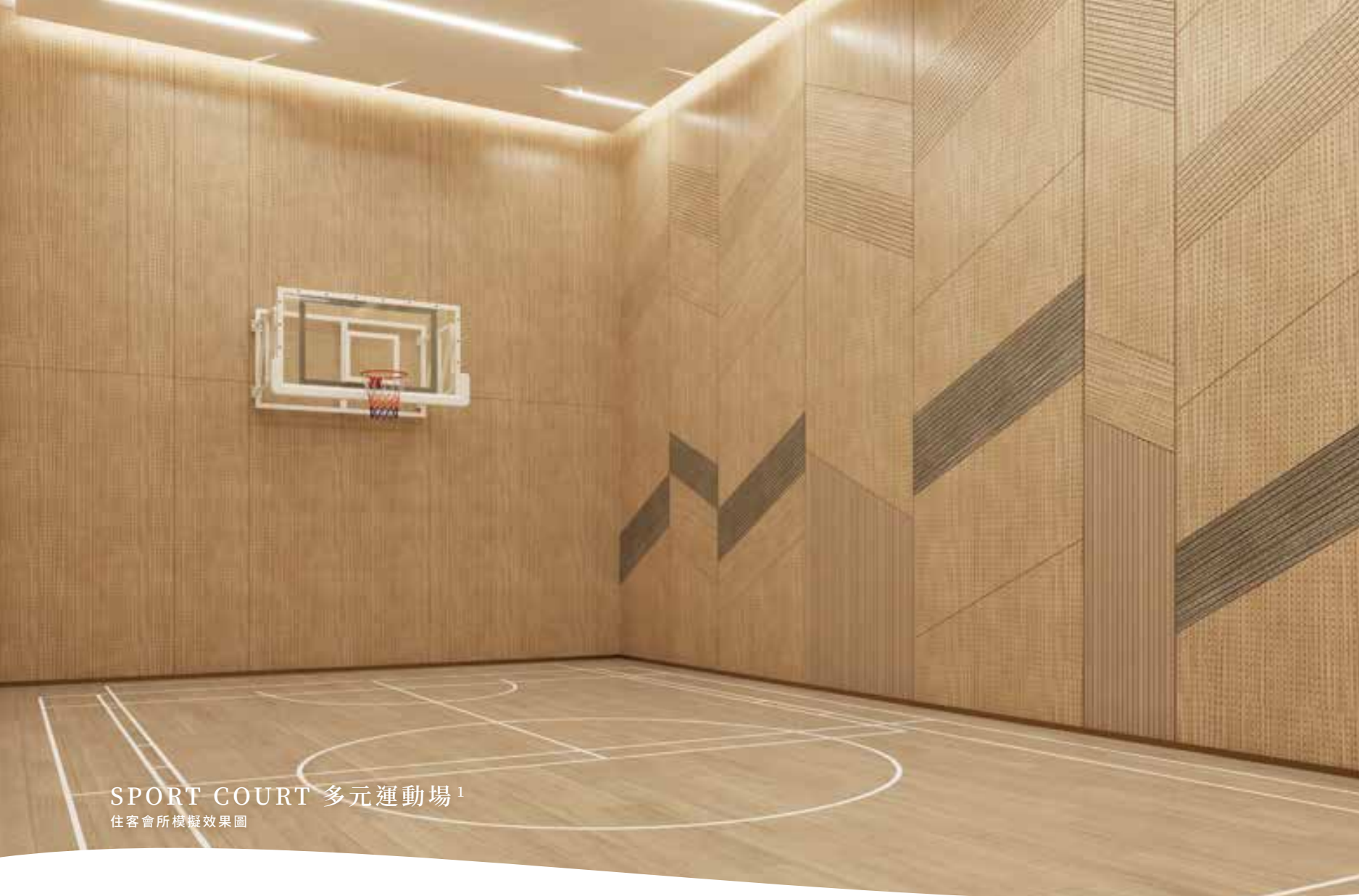
SPORT COURT 多元運動場 1 住客會所模擬效果圖