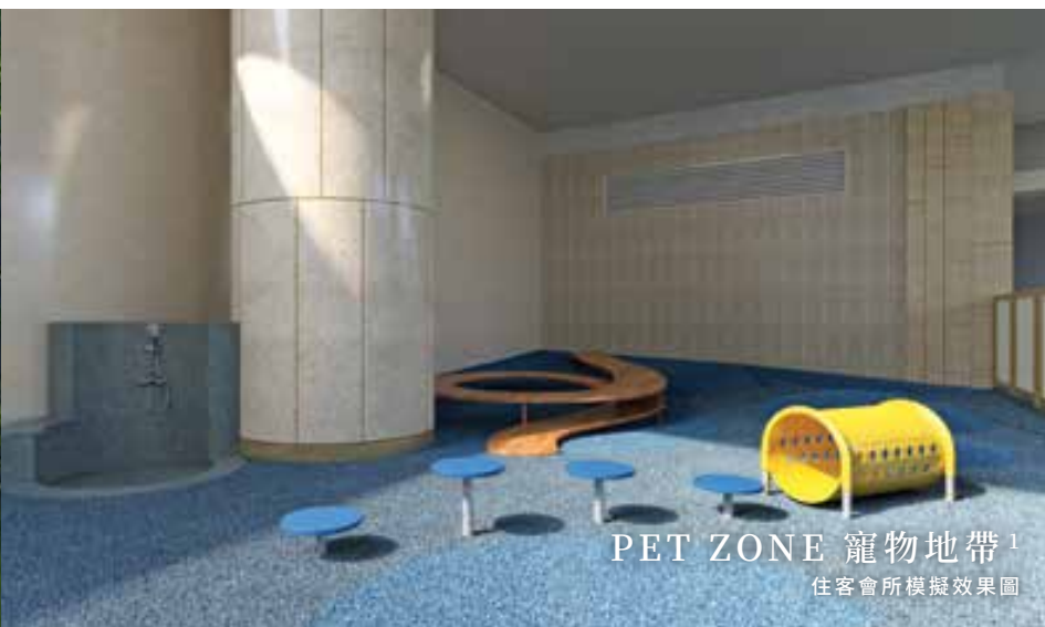
PET ZONE 寵物地帶 1 住客會所模擬效果圖