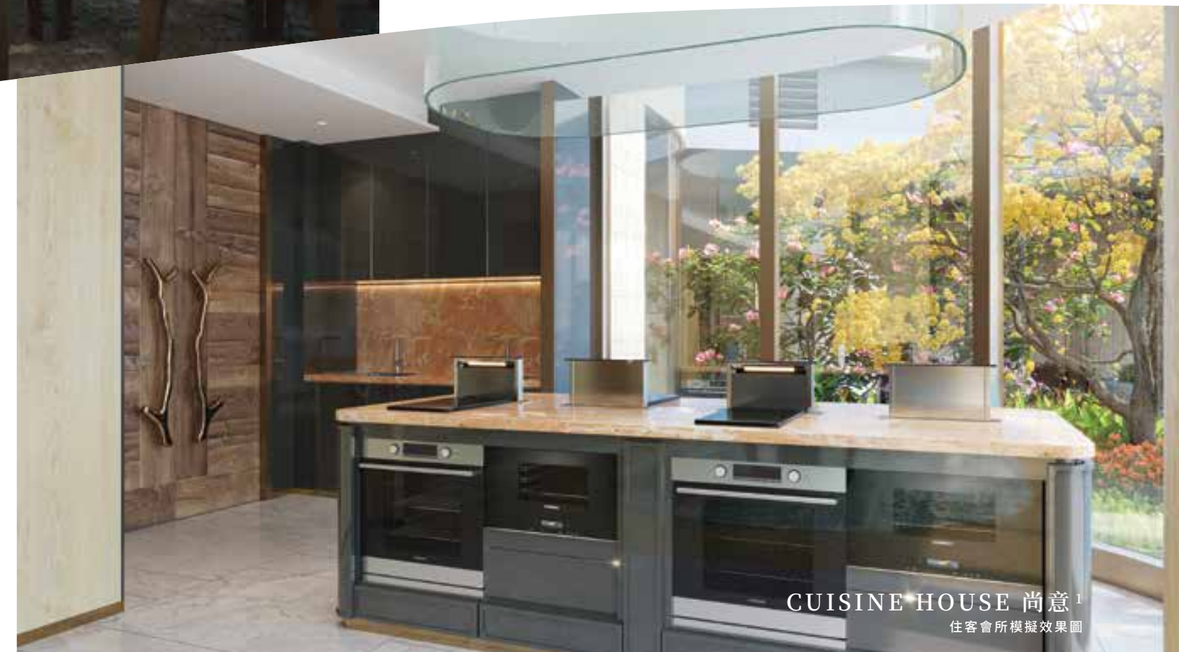
CUISINE HOUSE 尚意 1 住客會所模擬效果圖