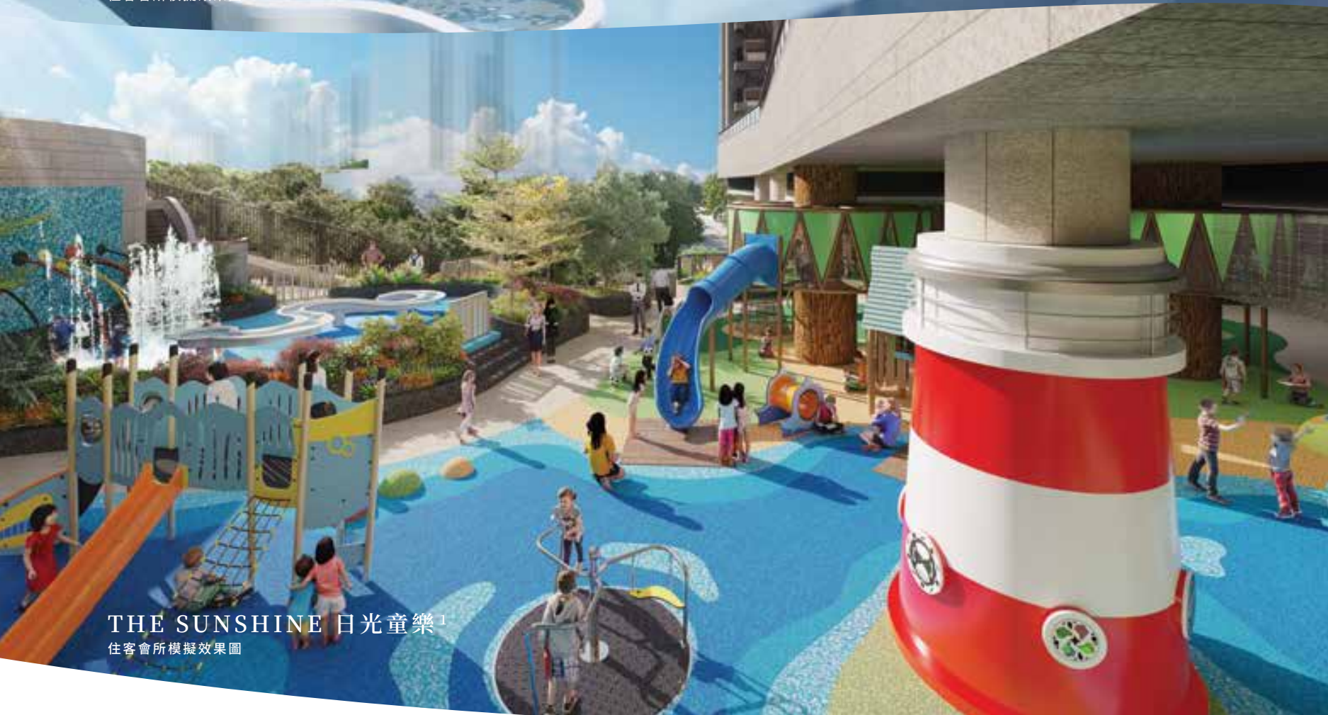
THE SUNSHINE 日光童樂 1 住客會所模擬效果圖

寓學習於娛樂，「Imagination STEAM 潛能空間」設有各種啟發智慧潛能的玩樂配設 1 ，可作為學童的興趣工作坊，著重於科學、科技、工程、藝術、數學等領域，充滿了趣味和教育的元素。