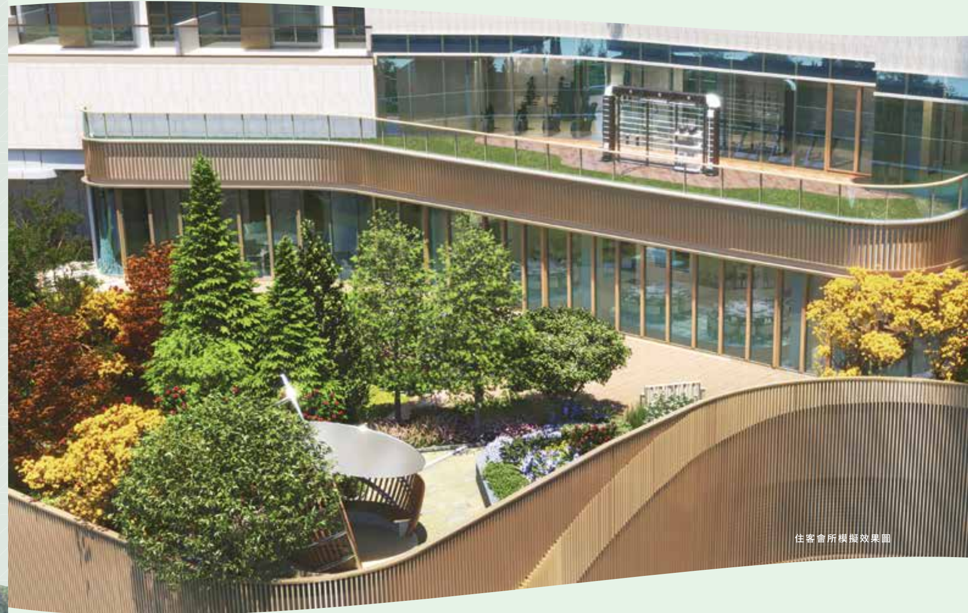
住客會所模擬效果圖