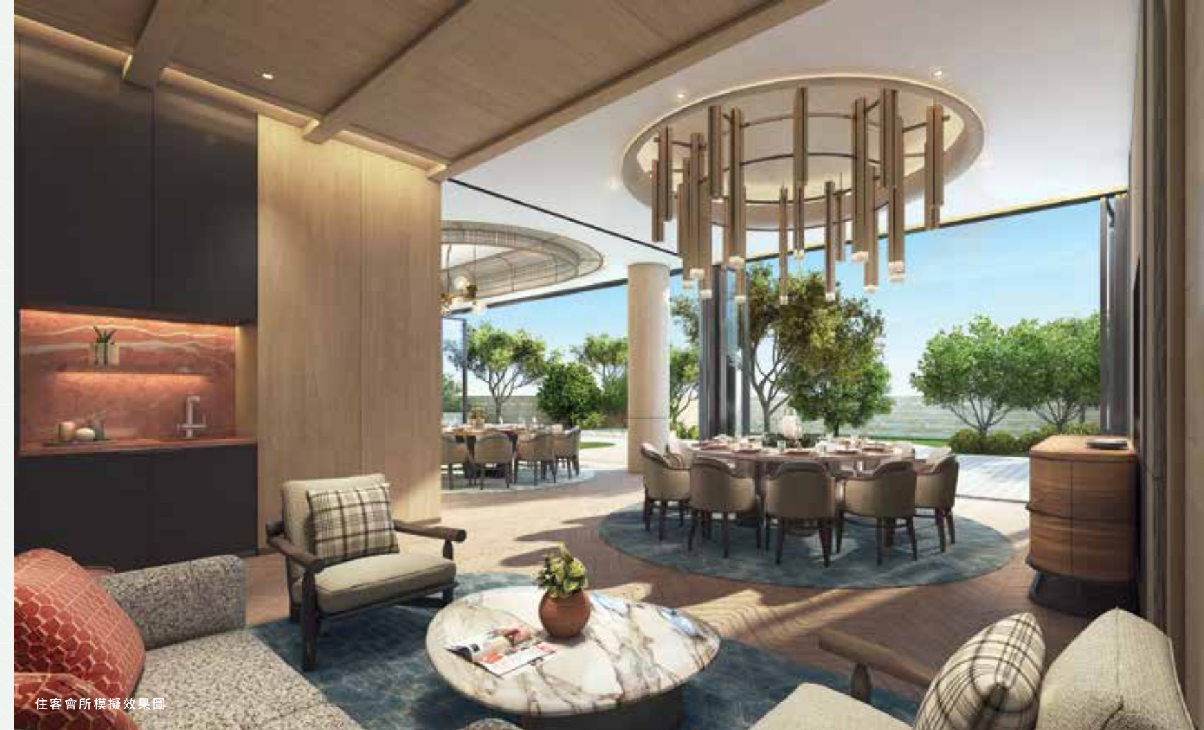
住客會所模擬效果圖