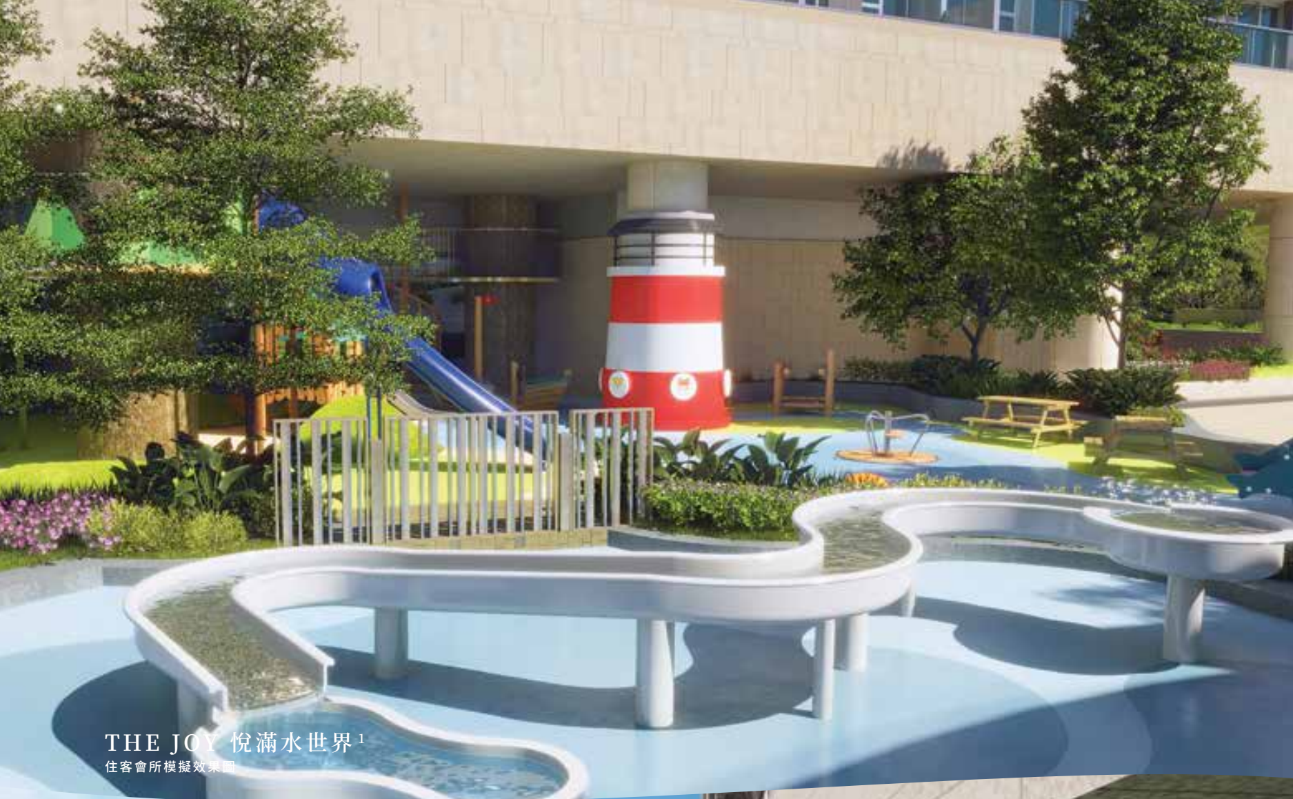
THE JOY 悅滿水世界 1 住客會所模擬效果圖