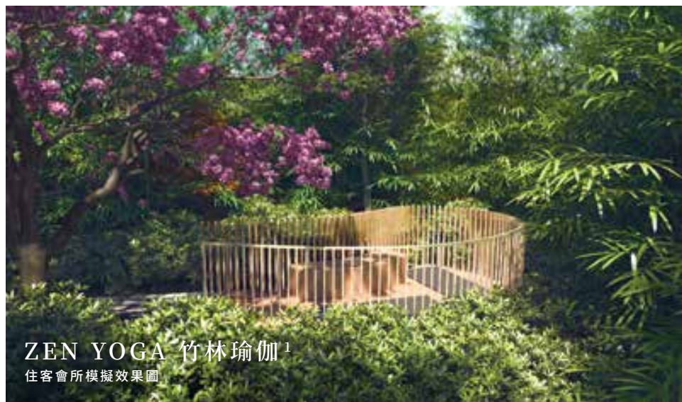
ZEN YOGA 竹林瑜伽 1 住客會所模擬效果圖

位於第1期會所 Club Uppland 的「Zen Yoga 竹林瑜伽」 1 、以竹林鋪設秀逸 1 ，挺拔的竹幹瀟灑氣正，節間溢出陣陣清幽，和煦陽光越過竹葉縫隙，化成翩翩氣質的樹蔭。天然的竹林環境 1 ，結合靜與動的瑜伽練習，拉展舒筋，專注釋放，瞬間融入自然深處，從呼吸到平衡，身心合一昇華。