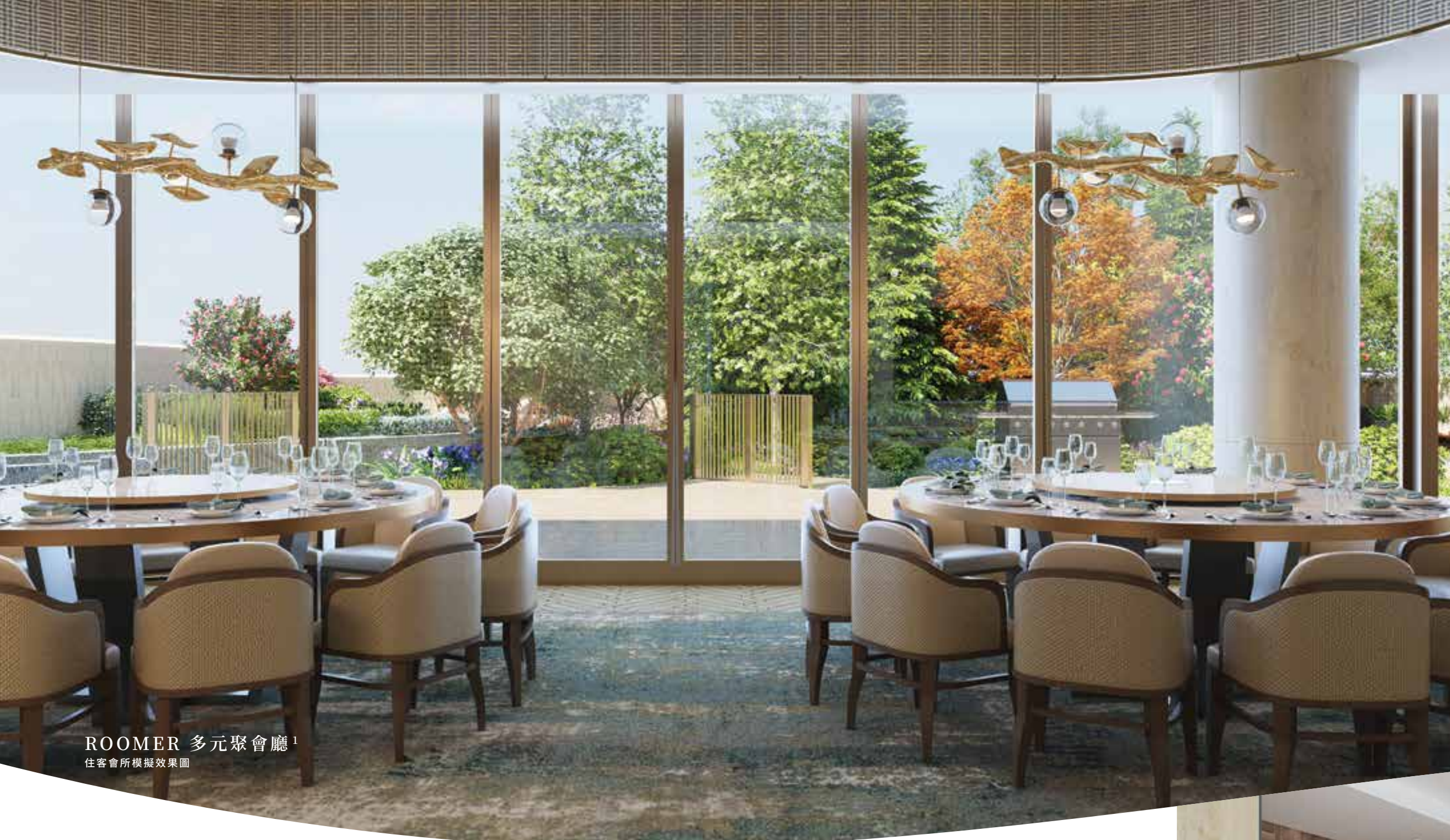
ROOMER 多元聚會廳 1 住客會所模擬效果圖