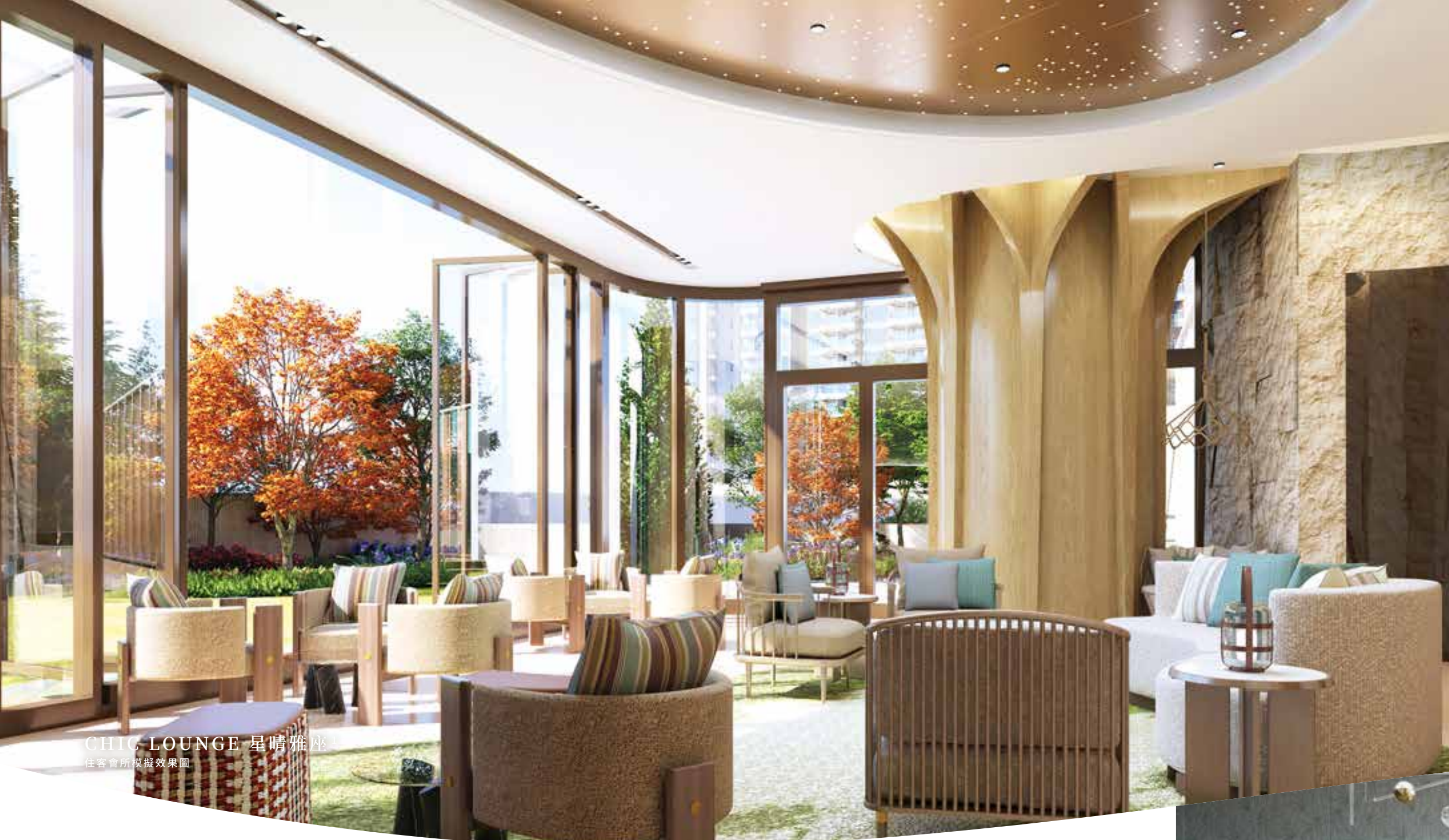
CHIC LOUNGE 星晴雅座 住客會所模擬效果圖