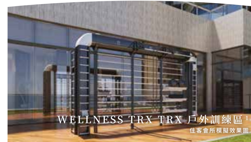
WELLNESS TRX TRX 戶外訓練區 1 住客會所模擬效果圖

「Spirit Gym 健身工房」 1 選用美國知名健身設備品牌 1 ，結合力學與姿態的成果，適切地鍛鍊肌肉線條，塑造出健美身段。