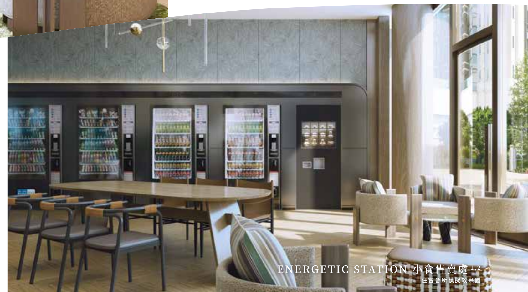
ENERGETIC STATION 小食售賣處 1,2 住客會所模擬效果圖

會所的多元休憩空間，不限於提供舒適場地，更貼心安排全天候設備，照顧住戶生活所需。特設的「Energetic Station 小食售賣處」 1,2 ，以自助形式售賣小食飲品及日常生活用品，住戶可隨時購買多款零食 1,2 ，配上冷熱飲品補充能量，即時來一場下午茶聚或晚間夜宵，一步之遙，稱心滿足。